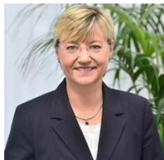
Kultusministerin Frauke Heiligenstadt